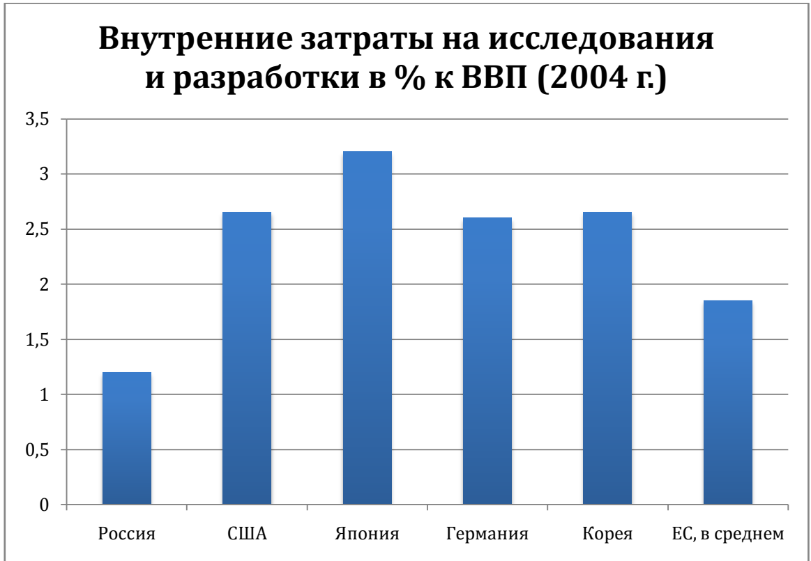
Рис. 2.